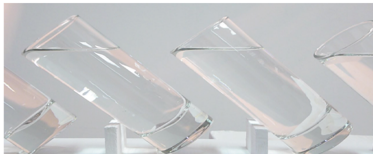
Από την ατομική έκθεση που έγινε στο ShipArt, Χώρο Τέχνης, Φεβρουάριο 2013

Η αναζήτησή μου γίνεται μέσα από το καθαρό νερό, ένα από τα στοιχεία της φύσης. Μια σταγόνα νερού, έχει τόση δύναμη, ώστε να φθείρει έναν βράχο ή να δώσει έμπνευση ώστε να γίνει ένα έργο τέχνης. Σταγόνες νερού μπορεί να γεμίσουν ένα ποτήρι και να ξεδιψάσουν έναν άνθρωπο. Νερό και μελάνι σε χαρτί μου δίνουν εικόνες που μιμούνται το νερό και ξεδιψούν την όρασή μου. Υπάρχει βροχή στο έργο μου, η οποία συμβολίζει την κάθαρση. Η κάθαρση μετατρέπεται σε αφαίρεση . Έτσι από ένα ποτήρι με νερό, εκείνο που δείχνω είναι η στάθμη και με αυτήν δημιουργώ ορίζοντες δροσιάς.