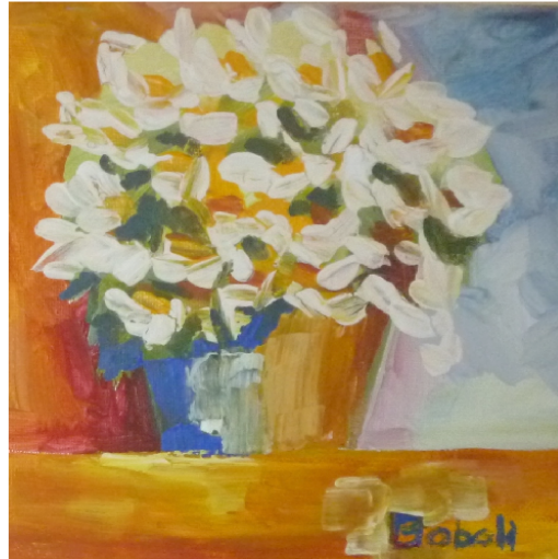
16 X 16 ακρυλικά 2013 30 €