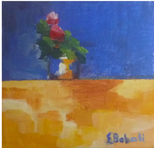
16 X 16 ακρυλικά 2013 30 €